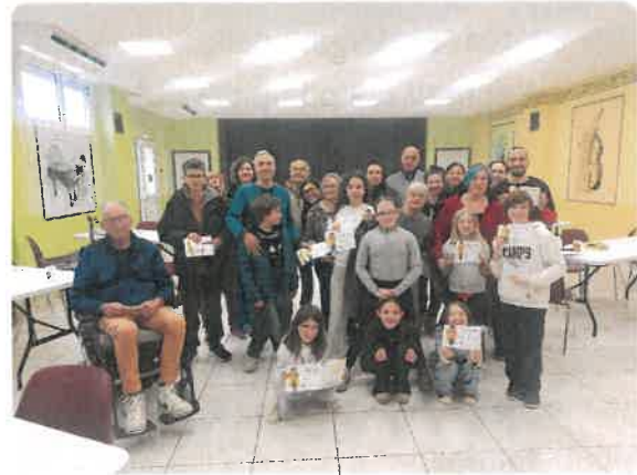
Concours Skyjo avec la médiathèque de Garde-Colombe